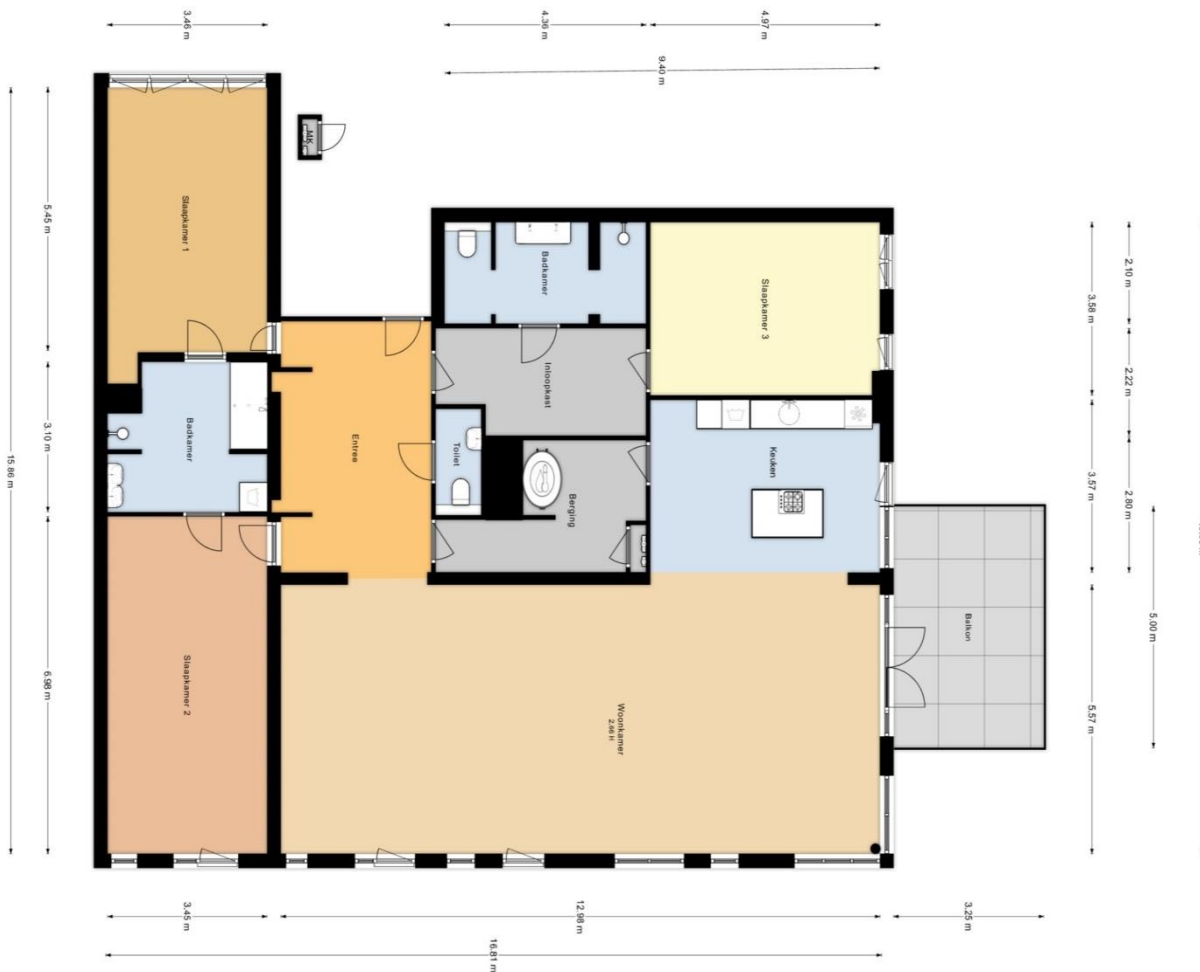
De 7 de verdieping - de huidige indeling